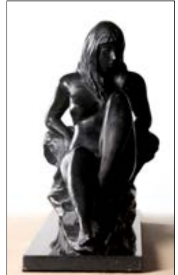
71 Cisne bronze 49 x 35 x 21 cm 1991