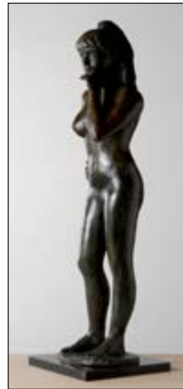
61 Meditativa bronze 80 x 24 x 19 cm 1989