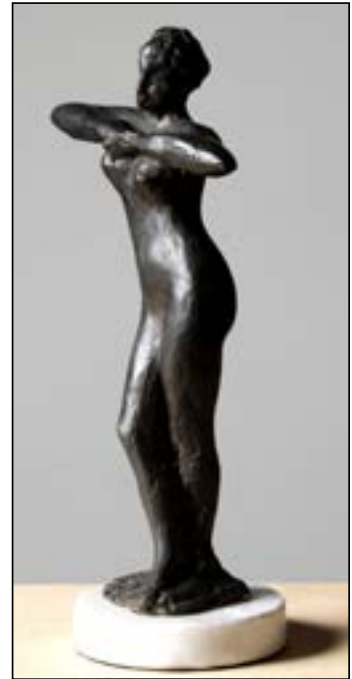
15| Perezosa bronze 28 x 13 x 6 cm 2011