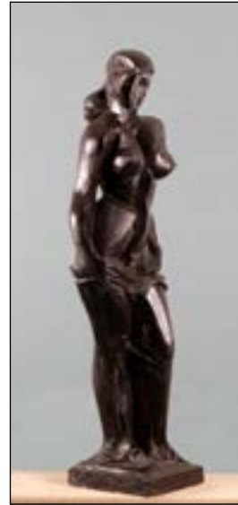
41 Venus Siglo XX cemento 122 x 36 x 28 cm 1986