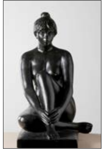
81 María Sentada bronce 62 x 51 x 36 cm 1994