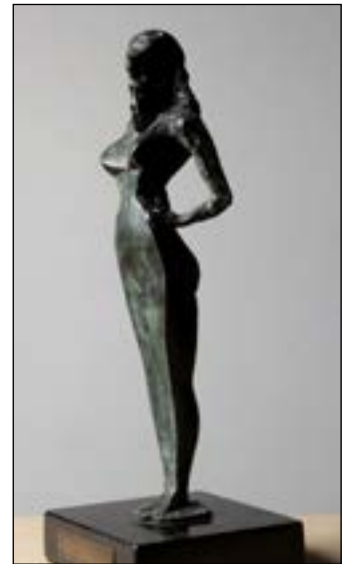
2| Core bronze 30 x 9 x 6 cm 1985