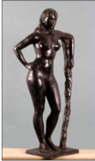
9| Anita bronze 151 x 59 x 52 cm 1995