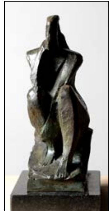
14| Pensativa bronze 22 x 14 x 10 cm 2006