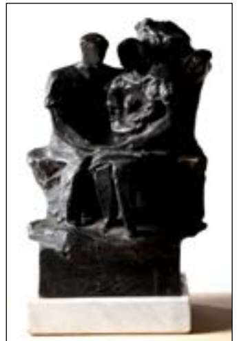
1| Familia bronze 30 x 18 x 15 cm 1972