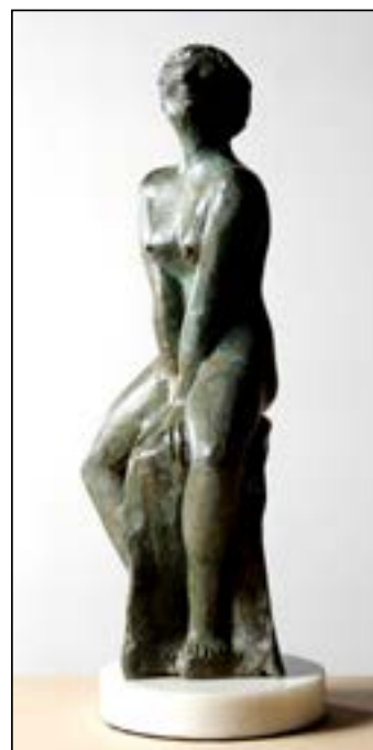
16l Descanso bronze 42 x 20 x 15 cm 2015