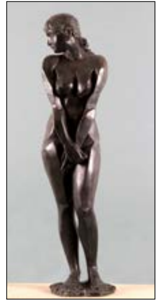
13| La Fuente bronze 128 x 36 x 35 cm 2002