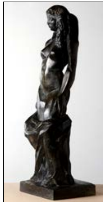
11| Helena bronze 72 x 23 x 20 cm 2000