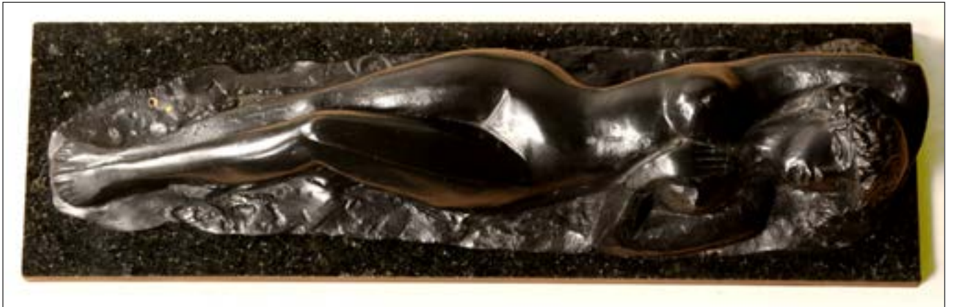
5| Verano . bronze . 56 x 14 x 10 cm . 1988