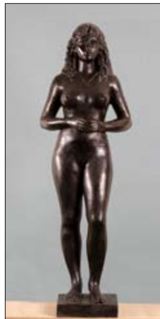
10| Patricia bronze 158 x 55 x 28 cm 1996